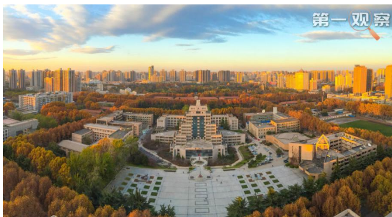
俯瞰西安交通大学校园

“为西部发展、国家建设奉献智慧和力量”，这是西迁人永恒不变的精神底色，也是西迁精神的新时代内涵。