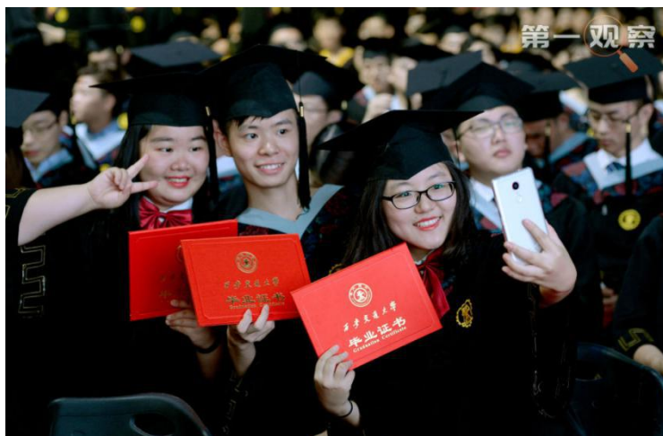
西安交通大学举行 2018 年毕业典礼

60 余年后的今天，在西迁精神激励下，广大青年弘扬胸怀大局、心有大我的爱国精神，艰苦创业、玉汝于成的奋斗精神，扎根实际、勇攀高峰的创新精神，公而忘私、埋头深耕的奉献精神，奋斗在新时代的广阔天地，必将书写新的青春华章。