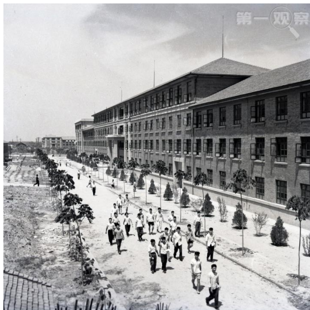
1959年拍摄的西迁后的交通大学校园一景（资料照片）

至1956年9月，包括815名教职工、3900余名学生在内的6000多名交大人汇聚西安，开启一段艰苦奋斗的峥嵘岁月。