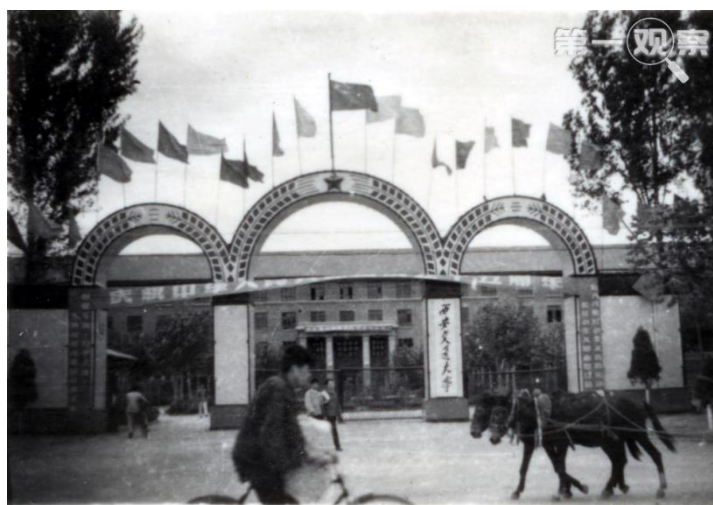
上世纪60年代初拍摄的西安交通大学校门（资料照片）

1955年，党中央、国务院从国家战略布局和西部工业发展需要出发，作出了交通大学内迁西安的决定。