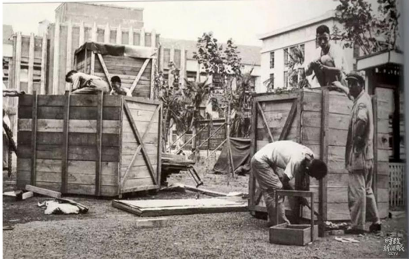
师生将设备装箱准备迁校。

1955年，为了社会主义建设和国防建设的需要，改变当时高等教育布局不合理的局面，支持西部地区经济社会发展，中央决定交通大学从上海迁往西安。