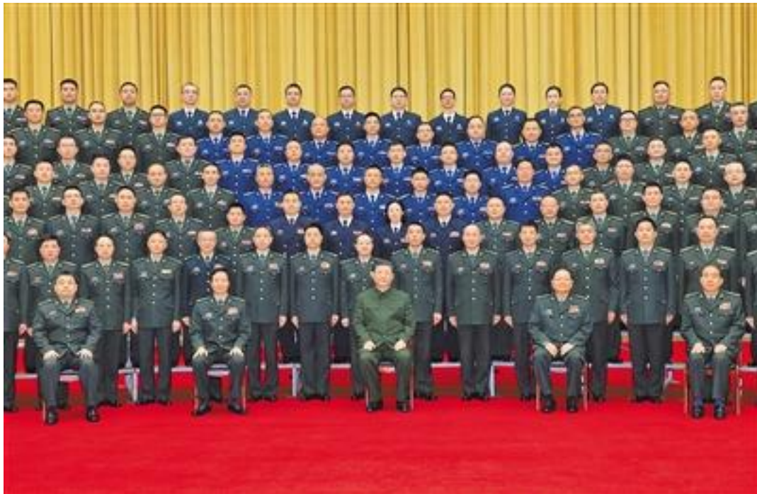
3月18日至21日，中共中央总书记、国家主席、中央军委主席