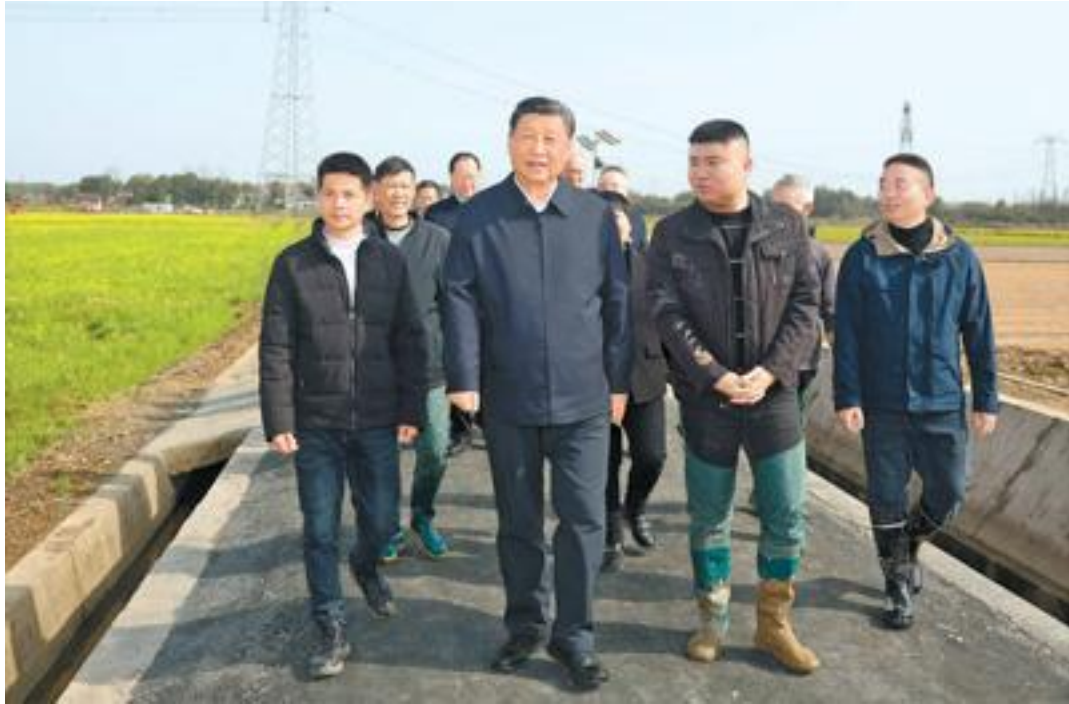
3月18日至21日，中共中央总书记、国家主席、中央军委主席习近平在湖南考察。这是19日下午，习近平在常德市鼎城区谢家铺镇港中坪村，同种粮大户、农技人员、基层干部亲切交流。