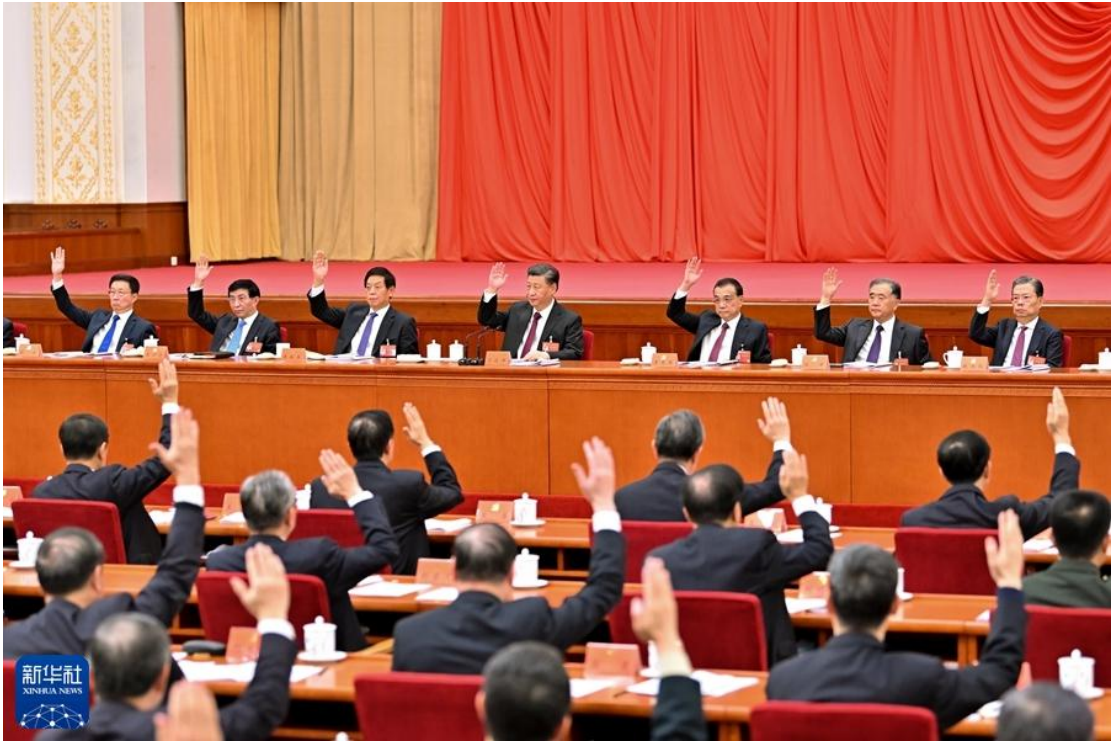
中国共产党第十九届中央委员会第六次全体会议，于2021年11月8日至11日在北京举行。这是习近平、李克强、栗战书、汪洋、王沪宁、赵乐际、韩正等在主席台上。

制定了到二十一世纪中叶分三步走、基本实现社会主义现代化的发展战略，成功开创了中国特色社会主义。