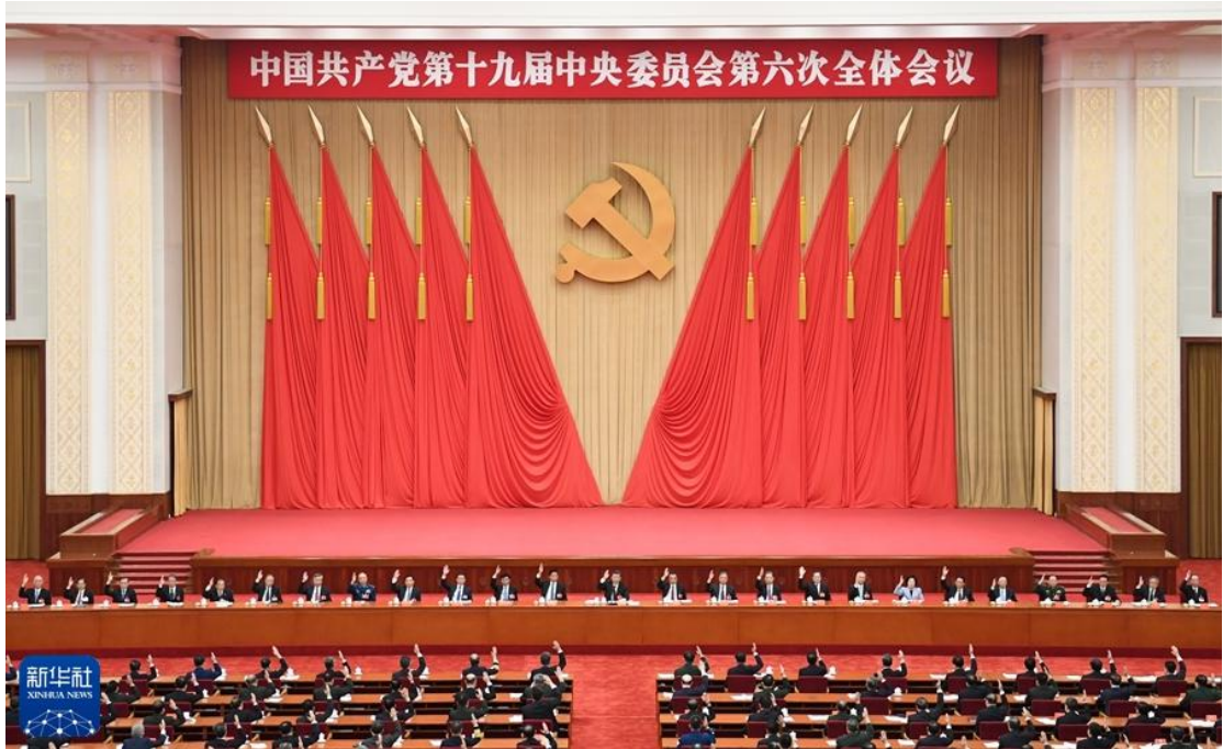
中国共产党第十九届中央委员会第六次全体会议，于2021年11月8日至11日在北京举行。

兴的宏伟目标继续前进。党领导人民自信自强、守正创新，创造了新时代中国特色社会主义的伟大成就。