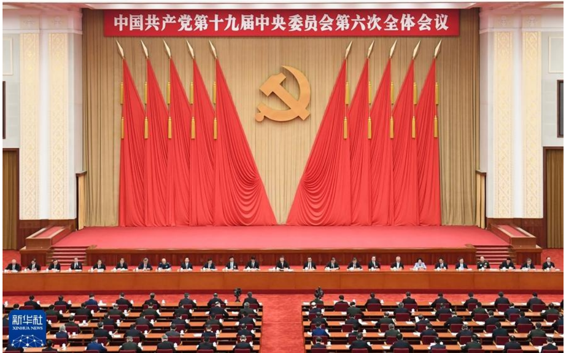
中国共产党第十九届中央委员会第六次全体会议，于2021年11月8日至11日在北京举行。

交在世界大变局中开创新局、在世界乱局中化危为机，我国国际影响力、感召力、塑造力显著提升。中国共产党和中国人民以英勇顽强的奋斗向世界庄严宣告，中华民族迎来了从站起来、富起来到强起来的伟大飞跃。